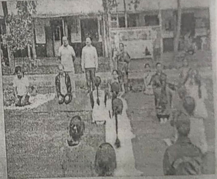
ಕಲಬುರಗಿ ಶರಣಬಸವೇಶ್ವರ ವಿಜ್ಞಾನ ಮಹಾವಿದ್ಯಾಲಯದಲ್ಲಿ ಯೋಗ ಶಿಬಿರದ ಒಂದು ದೃಶ್ಯ